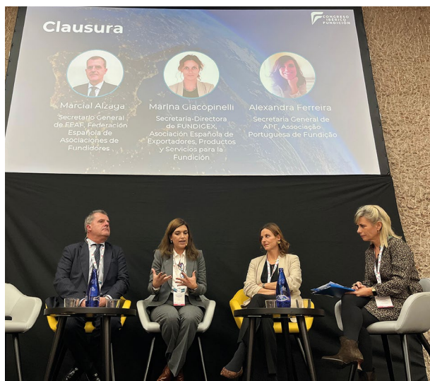
Clausura del Congreso.

Lanzaron un mensaje de agradecimiento a todas las personas y empresas participantes, que hicieron que el Congreso fuese un éxito y emplazaron al sector a una nueva edición de este evento.