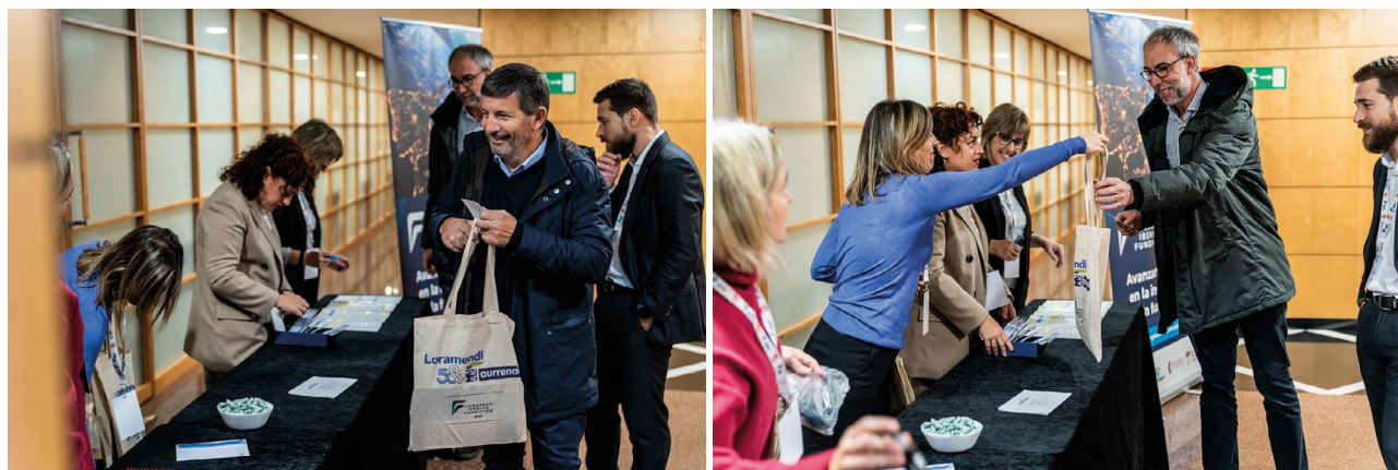
Recepción y acreditación de los congresistas.

Durante los dos días, además de disfrutar de las ponencias y paneles de expertos, los asistentes tuvieron la oportunidad de conocer las novedades de 11 proveedores de fundición, en la zona de exposición que se habilitó para ello.