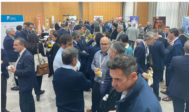
Pausa café en la zona de exposición.

A continuación de la pausa café, la tarde continuó con dos ponencias orientadas al área de las materias primas a cargo de HA Ilarduya, sobre soluciones innovadoras en moldeo en arena, y de FOSECO en referencia a los últimos desarrollos en recubrimientos refractarios.