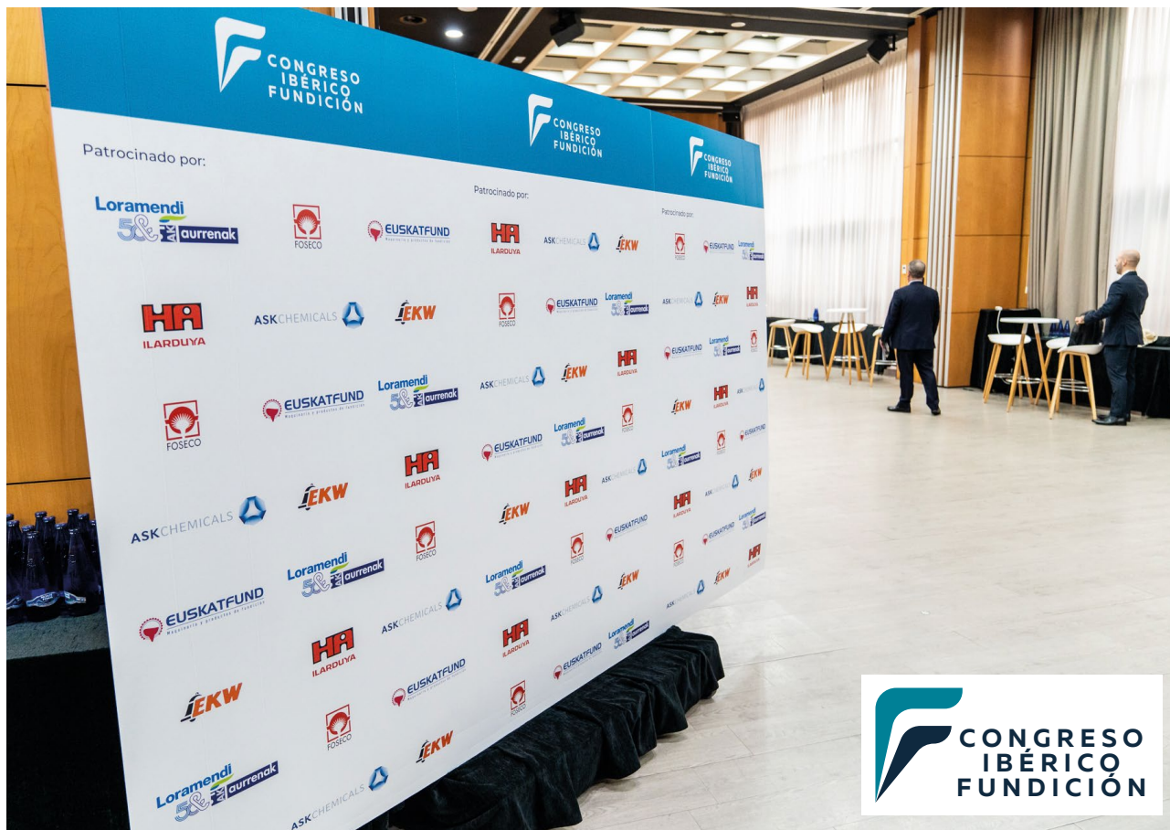
Patrocinadores del Congreso Ibérico de Fundición.

Después de meses de preparación, por fin celebramos el Congreso Ibérico de Fundición en Madrid, organizado por la FEAF, FUNDIGEX y APF (Associação Portuguesa de Fundação) y patrocinado por LORAMENDI & AURRENAK, FOSECO, EUSKATFUND, HUTTENES ALBERTUS ILARDUYA, ASK CHEMICALS y EKW GmbH Sucursal en España.