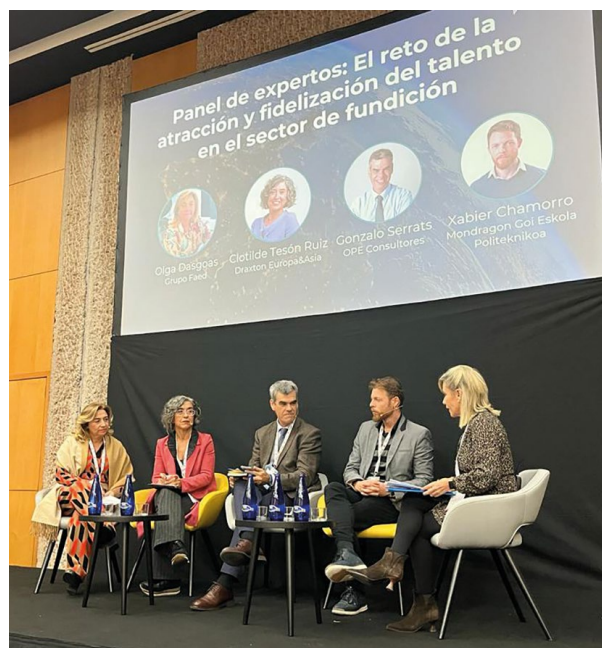
Panel de expertos sobre talento.

Antes de la pausa café, llegó el momento de conocer las oportunidades y tendencias en el sector ferroviario, gracias a la ponencia de MAFEX.