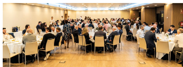
Cóctel y cena.