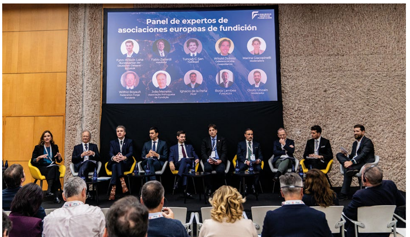
Panel de expertos de asociaciones europeas.