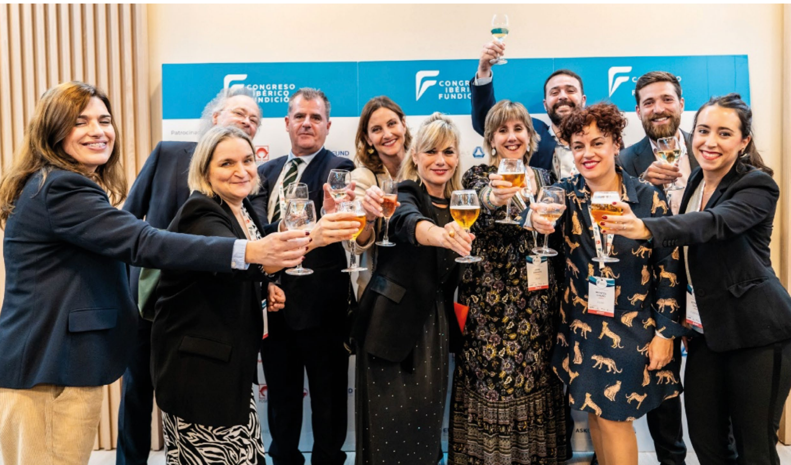
FEAF, FUNDIGEX y APF.

GRACIAS OBRIGADO ESKERRIK ASKO GRACIES THANK YOU MERCIE DANKE